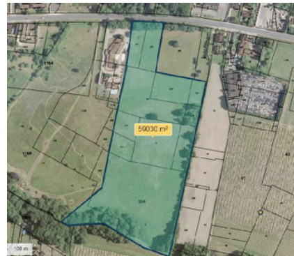
La Glutamine, c'est ici !